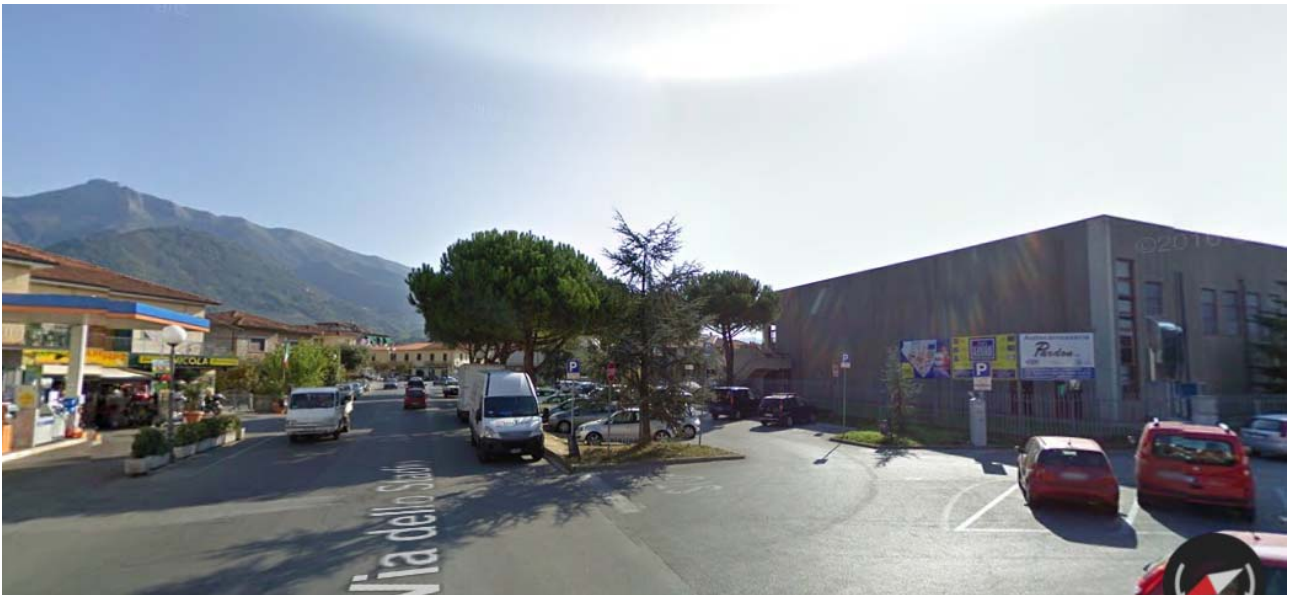
Il Palazzetto Comunale di Camaione

Palazzetto Comunale Via dello Stadio snc – Camaione (LU)