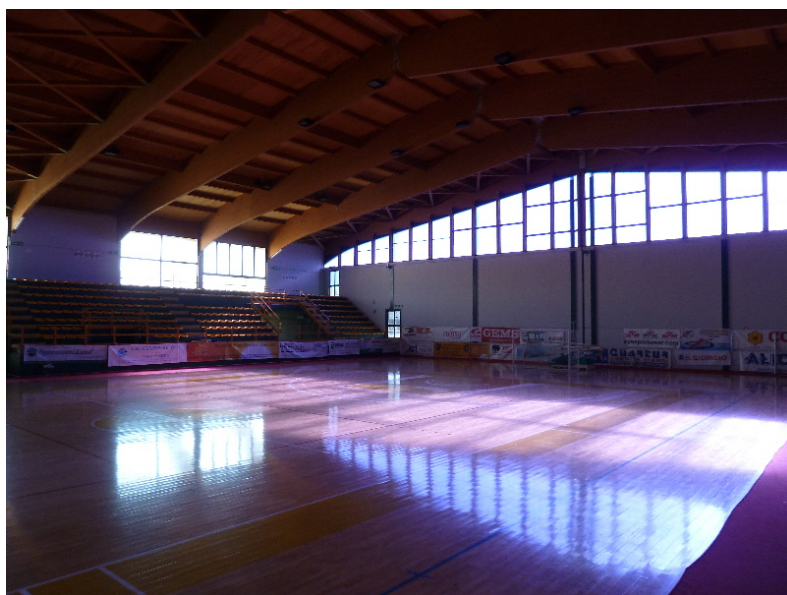
Il Pala Beethoven di Quartu Sant'Elena

Via Ludwig Van Beethoven - Is Arenas - Quartu Sant'Elena (CA)