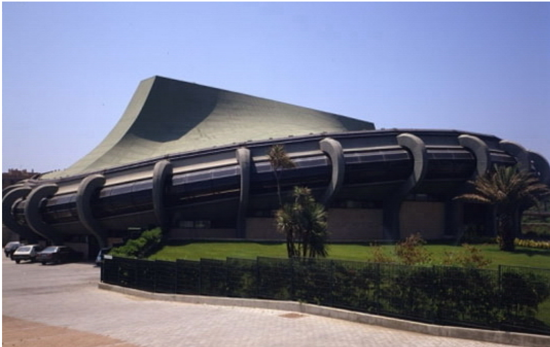
Il PalaPellicone del Lido di Ostia

“PalaPellicone” - Via della Stazione di Castelfusano – 00122 Lido di Ostia (RM)