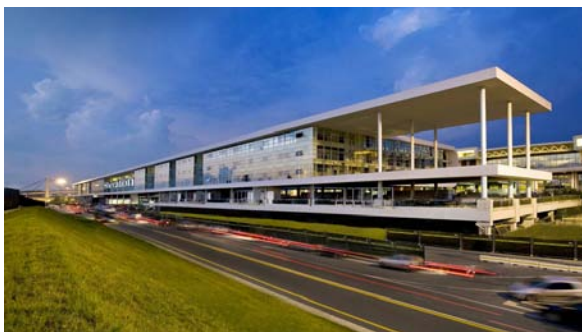
L'esterno dello Sheraton Milano Malpensa