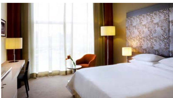
Camera “Classic” doppia uso singolo

La prenotazione delle camere allo Sheraton Milano Malpensa Airport Hotel, deve essere effettuata collegandosi al link www.starwoodmeeting.com/Book/fipe e procedere direttamente alla propria prenotazione, inserendo le date del soggiorno e la preferenza relativa alla tipologia di camera.