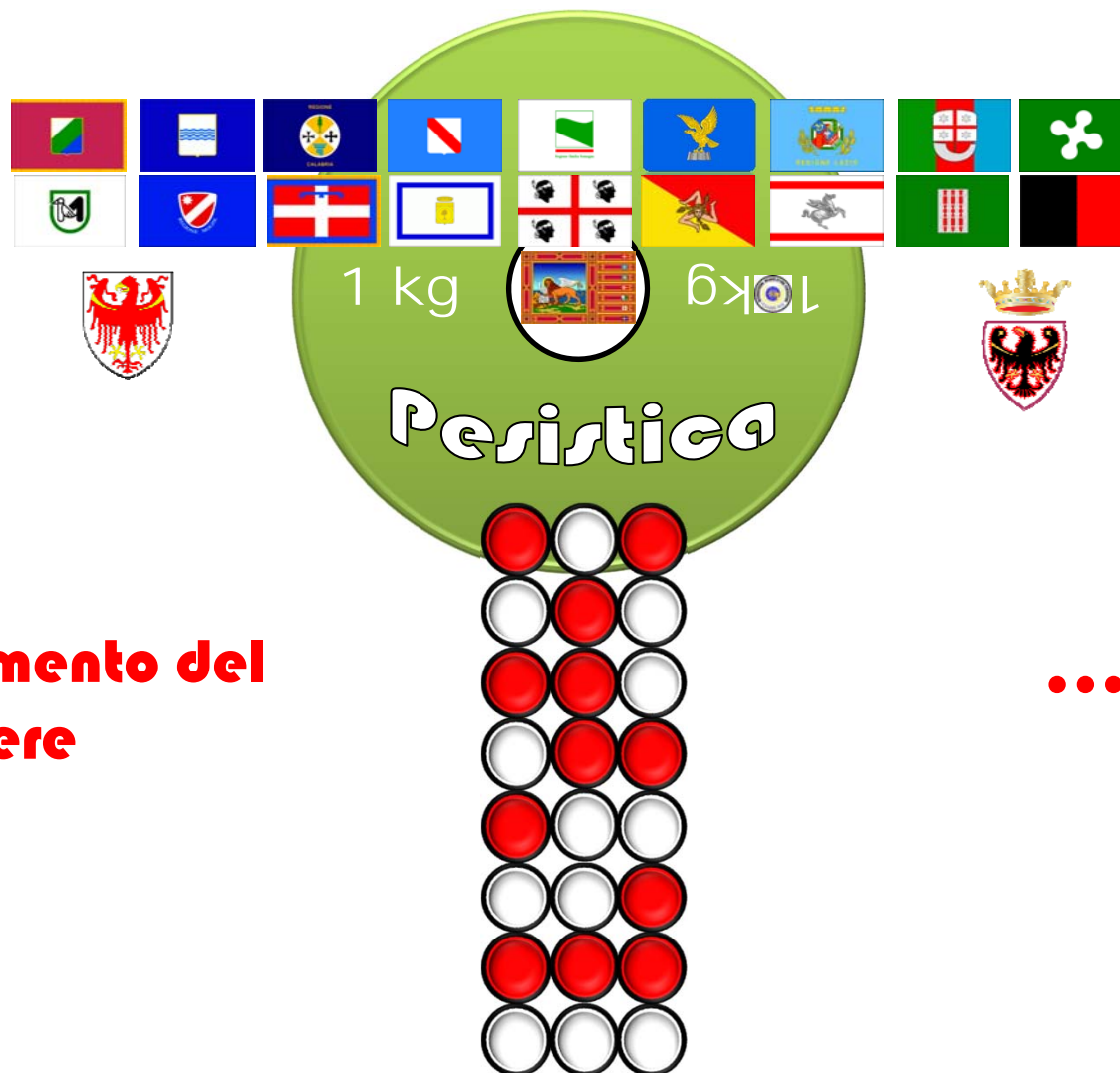
GRAFICO DEL CARICAMENTO RTI 3.3.3.11