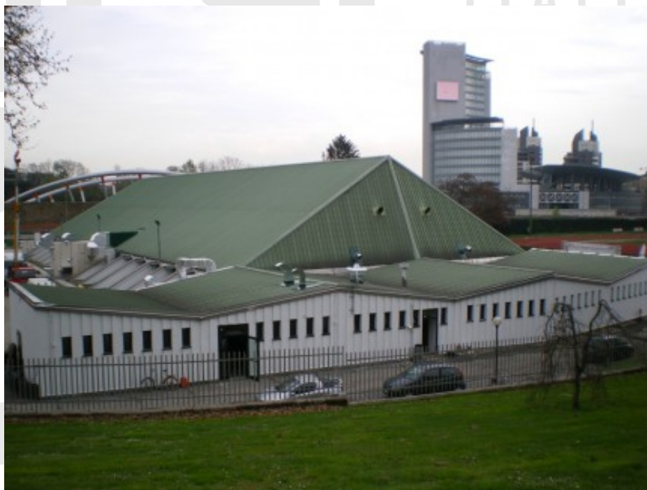
Visuale esterna del nuovissimo PalaBadminton di Milano

Obbligatorio: Tessera di Atleta Agonista 2009 FIPCF e documento d'identità.